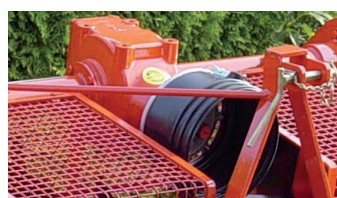
540 U/min. Getriebegehäuse