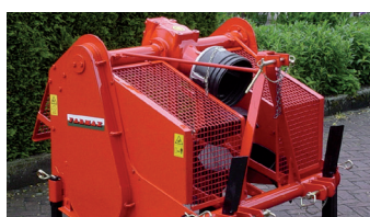
Auch ohne Kreiselegge erhältlich