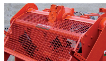
Mechanische Einstellung der Kreiselegge